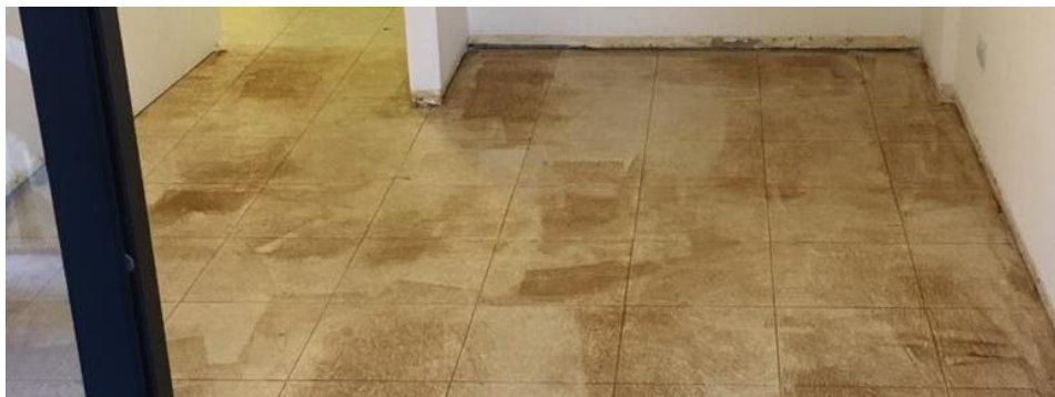
Piso Cerámico con Tarquini Base Mordiente B-51

La forma de saber que el secado de la Base Mordiente es el correcto, es cuando lo tocamos y el material se siente “pegajoso” pero no queda pegado en la mano.