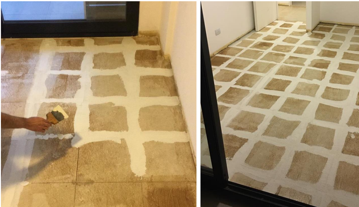
Tomado de Juntas con Tarquini Flex-Base

Hidratar y mezclar previamente el Componente "B" con agua generando una pasta cremosa para que, al incorporar el Flex-Base, no absorba el líquido del Flex-Base, de lo contrario será una mezcla de trabajo más rígida y será más difícil de trabajar.