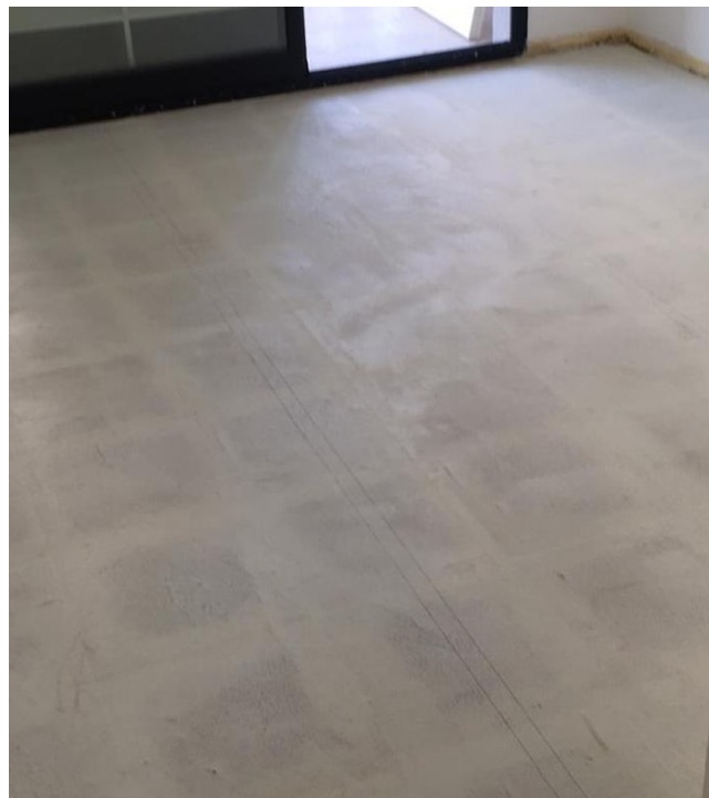
Superficie de trabajo cubierta con 1° Mano de Tarquini