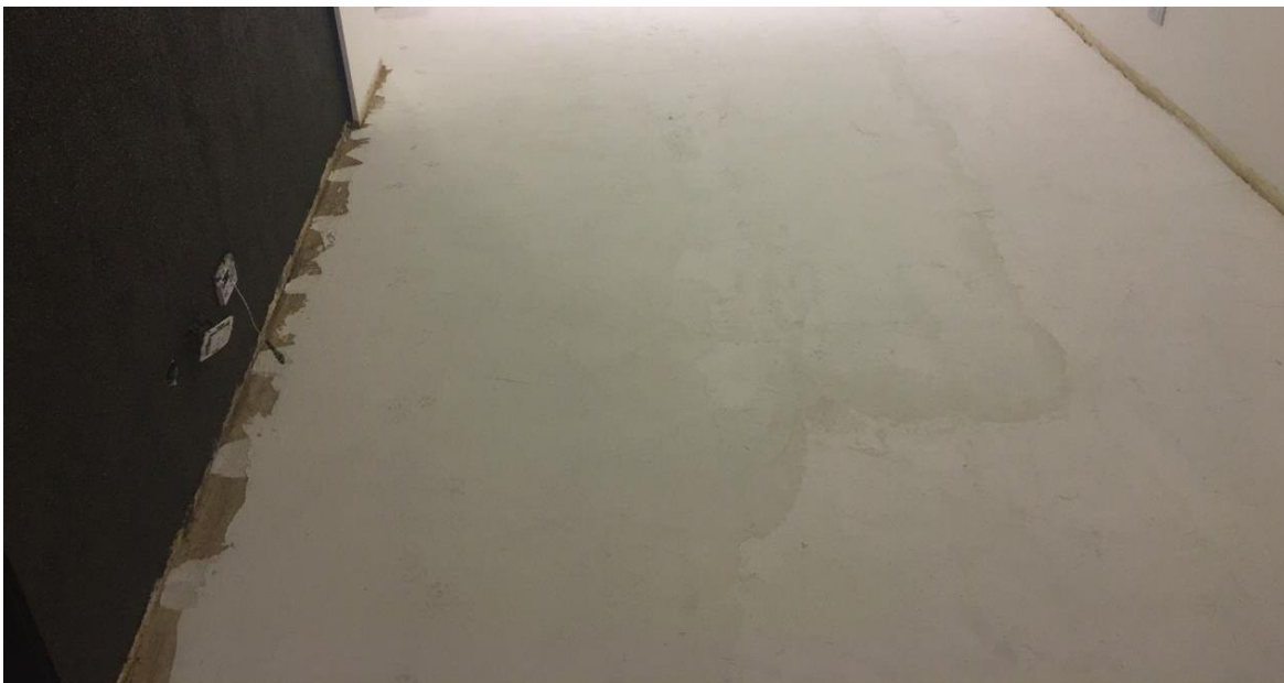
Superficie Cubierta con 2da Mano de Tarquini Flex-Base