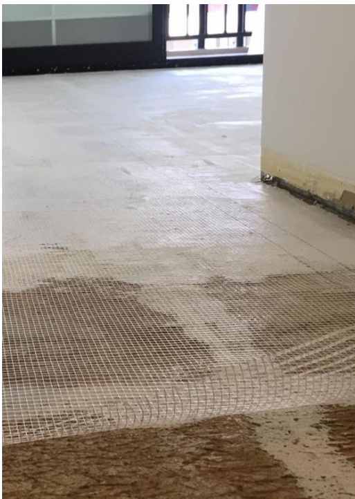
Opcional: Malla de Fibra pegada con 1° mano de Tarquini Flex-Base (Pisos, Placas de Yeso, Paredes Fisuradas)

Si va a trabajar sobre pisos o paredes fisuradas o placas de yeso con junta, este es el momento de aplicar la Malla de Fibra de Vidrio, pegándola al piso con el mismo Flex-Base. Se debe extender la malla sobre la superficie de trabajo y utilizar la llana metálica junto con la mezcla de Flex-Base para pegar la malla. Dejar secar de 4 a 6hs, siempre con el mismo criterio: luego de transcurrido ese plazo, debe poder transitar la superficie de trabajo sin que esta se deforme o altere.